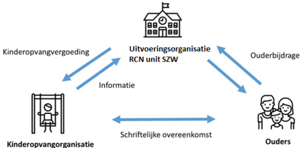
Figuur 3: Stelsel financiering op hoofdlijnen

In paragraaf 4.4 zijn de drie pijlers voor de financiering toegelicht: (1) de Rijksoverheid bekostigt kindercentra en gastouders rechtstreeks (2) er wordt gebruik gemaakt van gegevens over het gebruik van de kinderopvang en (3) ouders betalen een ouderbijdrage waarvan de hoogte afhangt van hun vastgestelde inkomsten. In Figuur 3 is het financieringsstelsel op hoofdlijnen weergegeven. Hierna wordt het proces verder toegelicht.