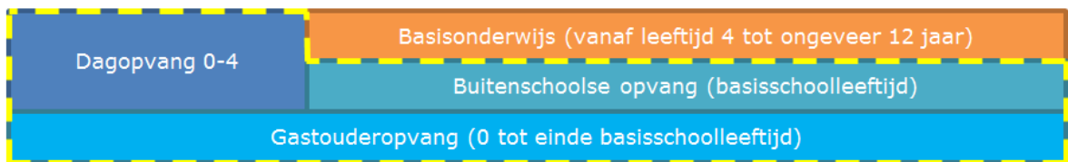
Figuur 1 Aansluiting kinderopvangstelsel en primair onderwijs

Het derde uitgangspunt is dat er voor kinderen in Caribisch Nederland sprake moet zijn van een doorlopende ontwikkel- en leerlijn, die start in de dagopvang en doorloopt in – in ieder geval – het primair onderwijs en de buitenschoolse opvang. Het kind staat daarbij centraal. Dat betekent dat kinderopvang, scholen, ouders en andere partijen in de jeugdketen samen zullen moeten werken om die lijn te borgen.